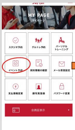
①② イベント予約を選択

※予約時の不正予約、無断キャンセルなどが発覚した際次回のイベント参加をお断りさせていただきます。