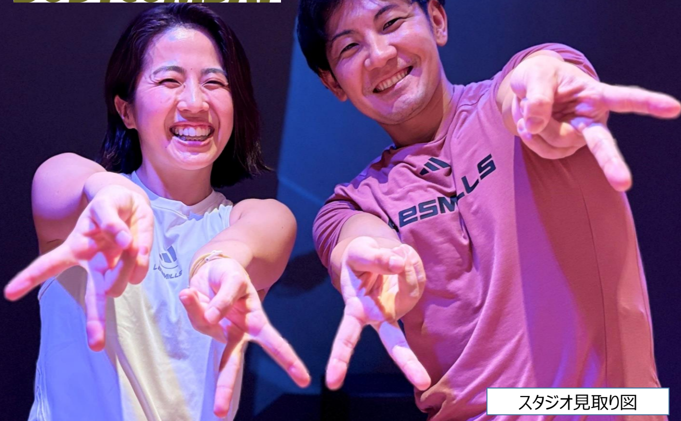
スタジオ見取り図