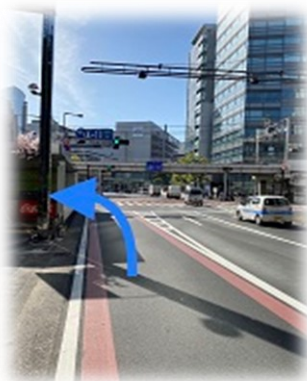
①川崎駅前東交差点を左折