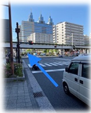
①日進町交差点を直進