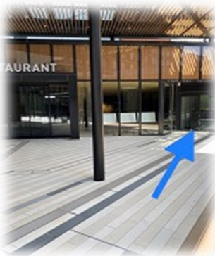
⑤ビルエントランス右側の自動扉が、Jexer川崎店の入口となりますので、こちらからお入り頂き、階段またはエレベーターで3階までお上り下さい