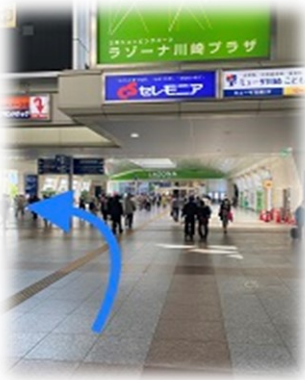
①改札を出て西口(ラゾーナ)方面へ