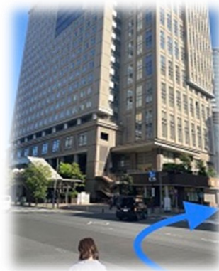
③シンフォニーホール前交差点を右折