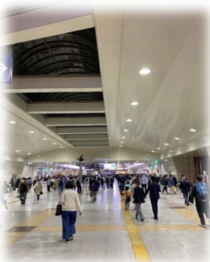
①ラゾーナ2階から駅直結の通路を駅方面へ