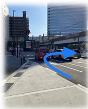
②日進町交差点を右折