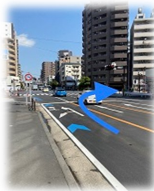
②南幸町二丁目交差点を右折