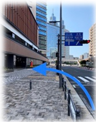
④カワサキデルタ駐車場に到着