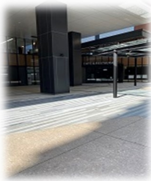
④正面のコンビニが入っているビルがカワサキデルタです