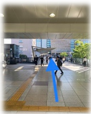
②改札手前右側の通路を直進